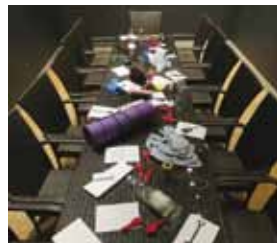
Fot. Julia Rzepka