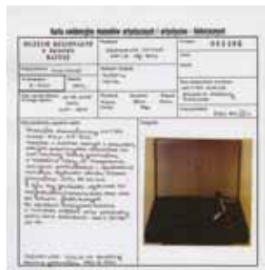
Karta ewidencyjna muzealiów