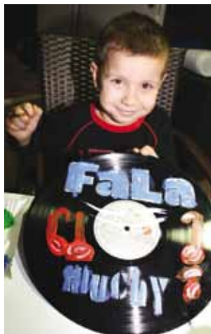
Fot. M. Castello Ołtarzewski